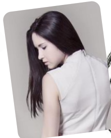
Abb. 1: asiatischer Haartyp

Zähle deine angekreuzten Symbole und lies den passenden Text.