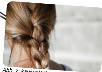
Abb. 2: kaukasischer Haartyp

Kaukasisches Haar findet man im europäischen Raum. Es ist mitteldick und existiert in verschiedenen Farbtönen von hellblond bis dunkelbraun und seine Struktur reicht von glatt über wellig bis hin zu Locken. Sein Durchschnitt ist dabei immer oval. Das heißt, die Haare können also großflächig aneinander reiben, was logischerweise eine stärkere Beanspruchung der Schuppenschicht zur Folge hat. Sie brechen leichter als asiatisches Haar.