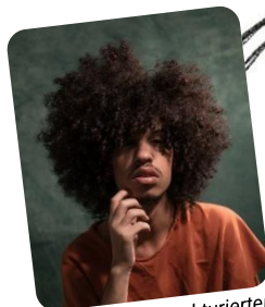
Abb. 3: afro-strukturierter Haartyp

Afro-strukturiertes Haar ist sehr kraus und die einzelnen Strähnen sind spiralförmig gelockt. Sein Durchmesser ist wie ein Band geformt. Afro-Haare sind anfälliger für Haarbruch als die anderen Haartypen, da sie wegen ihrer Form an vielen Stellen aneinanderreiben. Afro-Haare ergrauen im Durchschnitt 10 Jahre später.