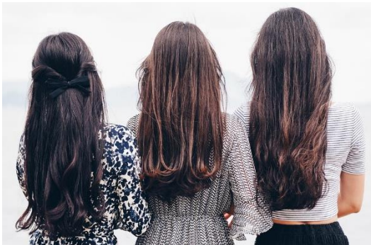
Abb. 4: Haartypen