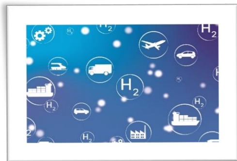
Abbildung 1: Wasserstoff-Technologien

Hochtemperatur-Polymerelektrolytmembran-Brennstoffzellen (HT-PEMFCs) werden mit einer Temperatur von bis zu 180 - 200 °C betrieben. Durch die hohen Temperaturen resultieren einige Vorteile gegenüber einer Niedertemperatur-Brennstoffzelle. Beispielsweise steigt auch die Aktivität des Katalysators mit steigender Temperatur. Entsprechend wird also bei HT-PEMFCs eine geringere Menge des kostenintensiven Katalysatormaterials benötigt. Die HT-PEM-FCs sind außerdem weniger anfällig gegenüber kleinsten Mengen an Verunreinigungen wie Kohlenstoffmonoxid im Wasserstoffgas. Man spricht hier von verminderter Katalysatorvergiftung. Kohlenstoffmonoxid kann sich auf dem Katalysatormaterial absetzen und dadurch die Leistung negativ beeinflussen. Die Anforderungen an die Reinheit des Wasserstoffs ist damit nicht so hoch wie im Falle der Niedertemperatur-Polymerelektrolyt-Brennstoffzelle. Eine hohe Reinheit des Kraftstoffs ist immer mit hohen Kosten verbunden, da es gereinigt werden muss.