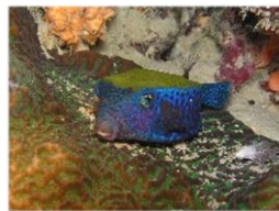
Abbildung 1: Kofferfisch

Bereits kurz nach der Jahrtausendwende entwickelten Ingenieurinnen und Ingenieure ein Automobil anhand einer besonderen Fischart. Als Vorbild für ihre Forschung nutzten sie Kofferfische. Diese in den tropischen Meeren vorkommenden Tiere gehören zur