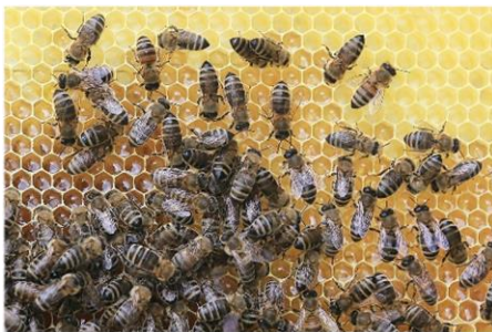
Abbildung 2: Bienenwaben

Achtung: Stelle vor deiner Recherche eine Vermutung an, warum Bienenwaben als Inspirationsquelle für Winterreifen dienen.