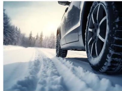
Abbildung 3: Autoreifen