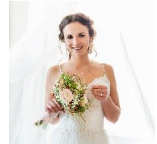
Abbildung 5