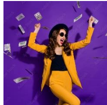
Abbildung 2