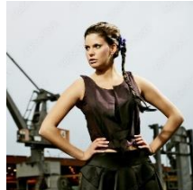
Abbildung 3