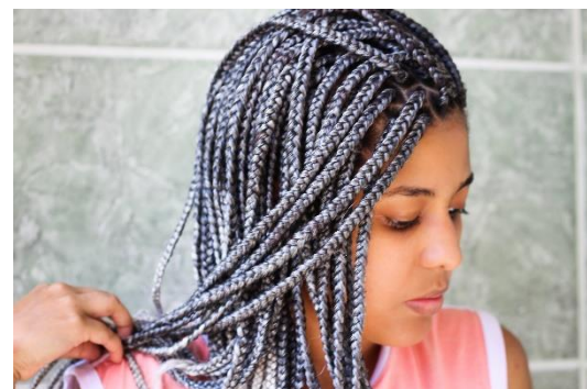
Abbildung 6: Junge Frau mit Braids

94,8 % der Friseur- und Kosmetiksalons sind kleine Unternehmen mit weniger als zehn Mitarbeitern. Gleichzeitig erwirtschaften sie aber 76,3 % des Branchenumsatzes. (Quelle: https://www.ibisworld.com/de/branchenreporte/friseur-kosmetiksalons/406/ )