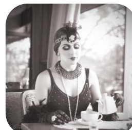
Abbildung 6