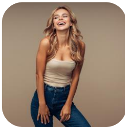
Abbildung 9