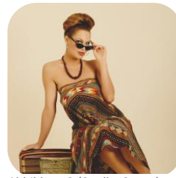
Abbildung 2