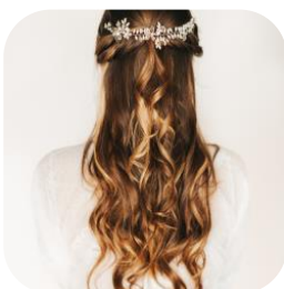
Abbildung 8