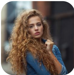
Abbildung 10

Wie bereits beschrieben wandeln sich mit den Schönheitsidealen auch die Schönheitsvorstellungen in Bezug auf die Frisur. Was heute im Trend ist, werden wir wahrscheinlich in 30 Jahren belächeln. Hier siehst du die Trendhairstyles der vergangenen Jahrzehnte. Es ist wichtig, dass Friseur/-innen bzw. Hairstylist/-innen neben handwerklichem Können ein besonderes Gespür für Mode und Stil haben, denn sie müssen einerseits gesellschaftliche Schönheitsideale berücksichtigen und umsetzen können, beeinflussen gleichzeitig jedoch auch selbst das gesellschaftliche Schönheitsideal.