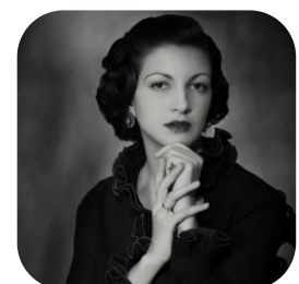
Abbildung 5