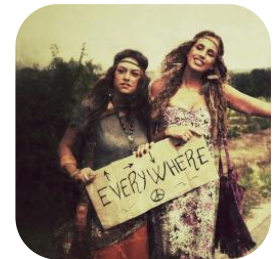
Abbildung 3