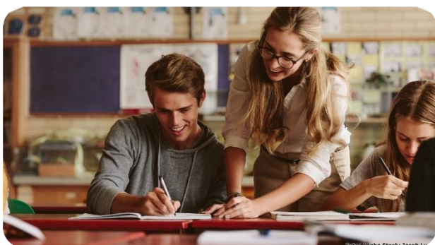
Abbildung 1: Schüler beim Kreativen Schreiben

Dieser Fachartikel bietet einen Überblick zum Stellenwert des Kreativen Schreibens innerhalb der Deutschbeziehungswissenschaftlichen Schreibdidaktik und reflektiert Möglichkeiten sowie Ideen, mithilfe des Kreativen Schreibens die Auseinandersetzung mit gesellschaftsrelevanten Fragestellungen im Deutsch-Unterricht zu unterstützen.