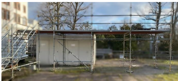
Abbildung 2: eigene Aufnahme

Tipp: Manchmal verraten Schilder am Gerüst, wofür es genutzt wird. Sucht auf euren Fotos nach Hinweisen.