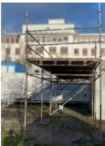
Abbildung 1: eigene Aufnahme